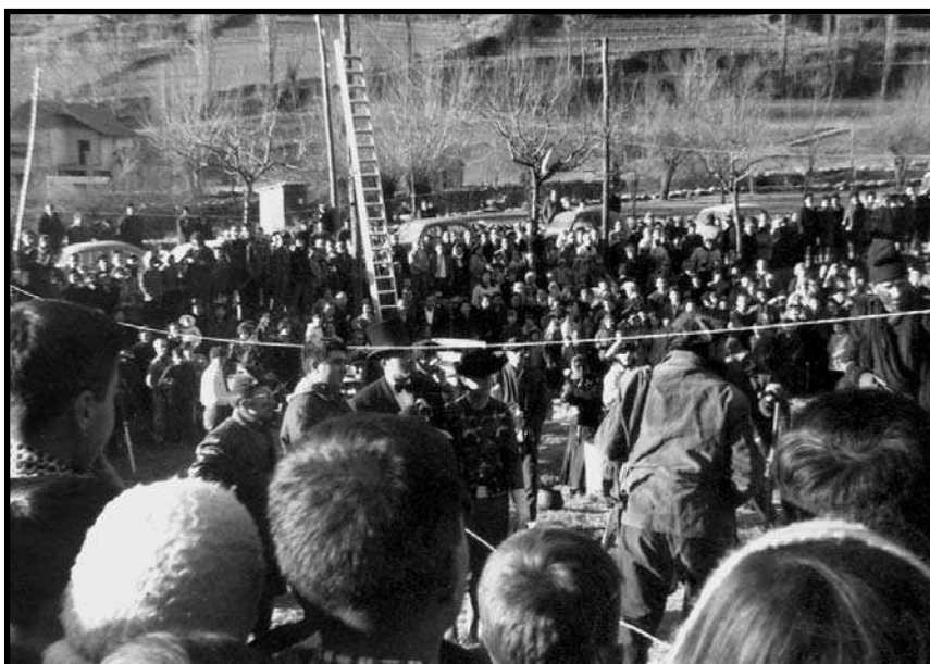
El moment final de l'espectacle, l'any 1959, on s'aprecia molt bé la gran quantitat de públic que atreia el Ball de l'Óssa.

Considerem, en canvi, que és la sàtira la que dota de sentit el Carnaval d'Encamp, la que el fa comprensible per part de la societat urbana encampadana actual. La tradició, l'embolcall de la festa –la data en què se celebra, l'escenari cobert de palla, el fet que els personatges siguin dallaires o senyors dalt d'un carro, la mateixa óssa– no són llegibles pels encampadans actuals pel simple fet que aquest ja no és el seu món. L'embolcall, doncs, només serveix per conferir prestigi al que es dirà –el prestigi que li atorga a tot acte el fet que sigui històric o tradicional–, per diferenciar els discursos del Ball de l'Óssa dels que pogués pronunciar qualsevol persona des d'un speaker's corner qualsevol. La sàtira, en canvi, és l'únic fil que uneix el ritual del passat i el ritual del present, l'únic element que era llegible abans i que és llegible ara perquè satiritzar la societat tenia tant sentit pels encampadans de principis de segle XX com pels de principis del XXI. Els temes objecte de la dissecció satírica de la societat evolucionen, evidentment, amb el temps, però la sàtira com a concepte es manté. I no només es manté, sinó que creix en importància i en espai ritual: així, mentre que l'aparició en escena de l'óssa o dels senyors és cada cop més breu, la fase ritual protagonitzada pels dallaires –la que conté el gruix del discurs satíric– és cada cop més llarga. La sàtira, doncs, no només garanteix la llegibilitat i la continuï-