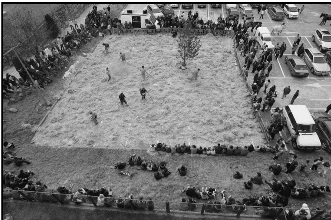
Vista general de la part inicial de l'espectacle d'enguany.