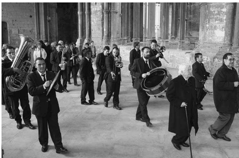
La Banda de la Unió Musical San Diego del Lloc Nou d'En Fenollet, tocant al claustre de la Seu Vella durant el Mig Any Fester.